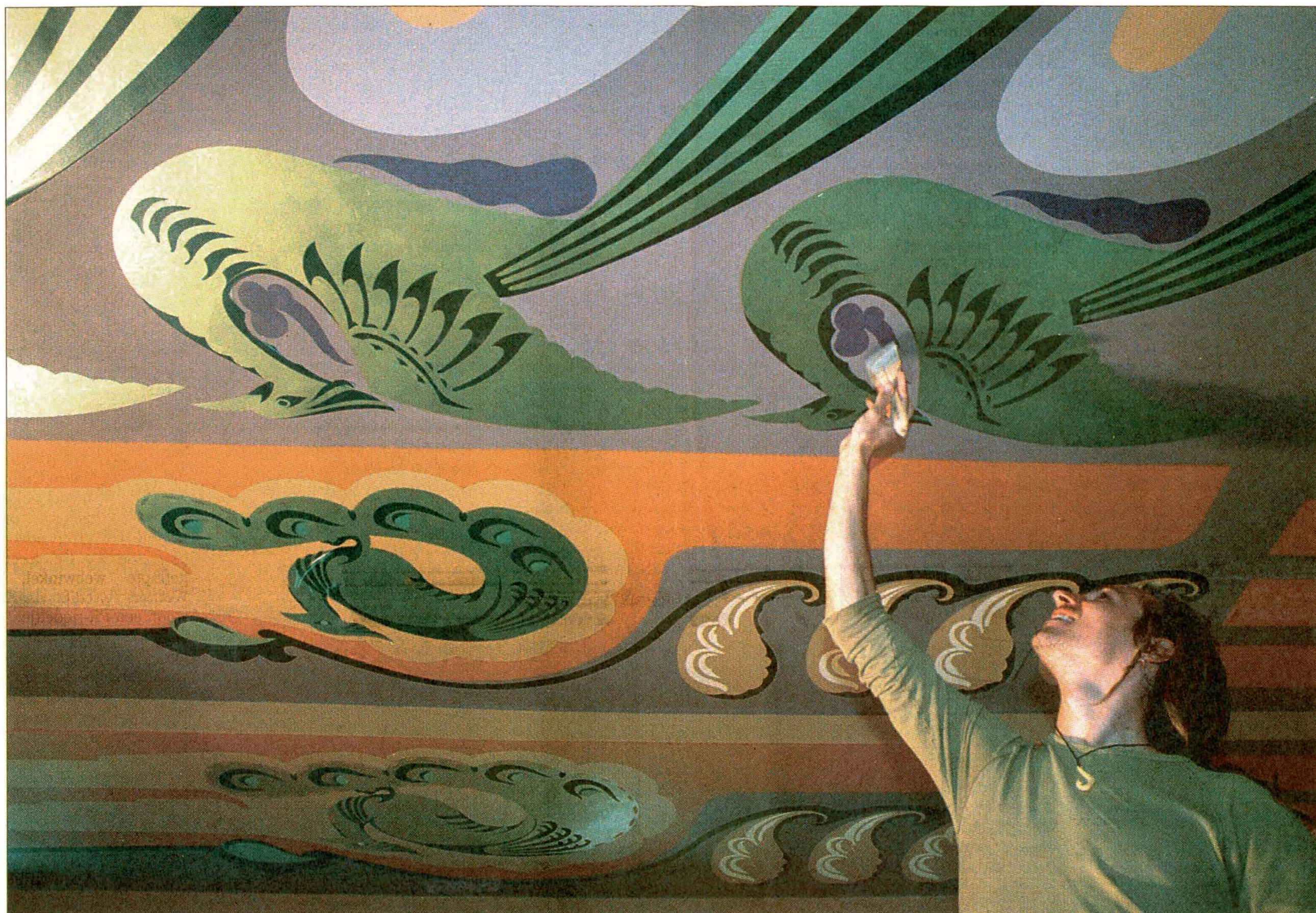
Een restauratieschilder van het Haagse bedrijf Rescura retoucheert de beschildering van de Rotterdamse decorateur en kunstschilder Pieter den Besten.

Uit die tijd dateren de hoog nabij het plafond gelegen schilderijen van Pieter den Besten (1894-1973). Van zijn werk bleef, onder meer door het bombardement op Rotterdam, vrijwel niets bewaard. De afgelopen maanden werden heel behoedzaam de afbeeldingen door Rescura blootgelegd: zestien vrouwen kijken nu neer op het publiek en twee figuren in het midden bekijken een schilderij met een pauw. De vrouwen zijn allen verschillend. Hun gezichtsuitdrukking varieert van hooghartig tot charmant. Het zijn geen afbeeldingen van werkelijke filmsterren, maar art deco gestileerde figuren met lijnen en geometrische motieven. Voor restaura-