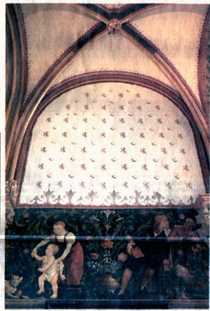
Een van de talrijke wandschilderingen die inmiddels in de oude staat zijn hersteld.

Palmboom Tijdens de eerste officiële bezichtiging op een ijzige winterochtend blijkt geen vierkante centimeter onversierd. Boven deuren prijken latijnse spreuken die zoveel moeten betekenen als „Eens wordt de stek een boom" en „De palmboom groeit tegen de verdrukking in". Onder een imposant gewelfde koepel, met veel glas-in-lood, zijn fabels van La Fontaine verbeeld en de hoge statige trappen die perronwaarts voeren, worden gedomineerd door een maar liefst twee meter