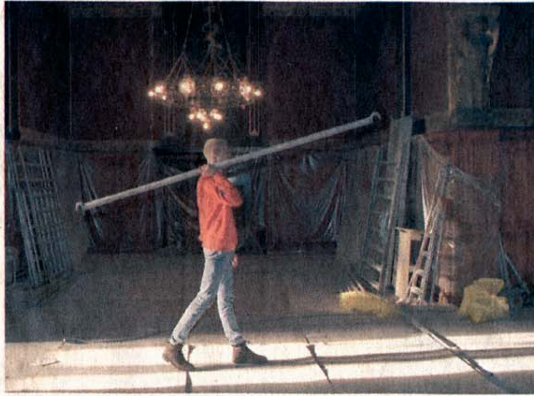
Naar verwachting half februari zijn de werkzaamheden in de koninklijke wachtkamer op Amsterdam CS afgerond.

Van plint tot plafond wordt de koninklijke wachtkamer op Amsterdam CS deze dagen gerestaureerd. De werkzaamheden vorderen in rap tempo. Waardevolle, acuut bedreigde olieverfschilderingen uit de vorige eeuw zijn in ere hersteld. Centimeters diepe scheuren met zorg gedicht, bladgoud ont-daan van het vuil van decennia. Deskundigen tonen zich verrast door de resultaten, de Spoorwegen zijn diep onder de indruk. Nauwelijks gewaardeerde schilderijen blijken bij nader inzien opmerkelijke staaltjes negentiende-eeuwse schilderkunst. Een reportage uit de 'wachtkamer van Beatrix'.